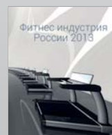
Каталог Фитнес индустрия