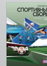
Журнал Спортивные сборы