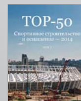
Каталог TOP-50 Спортивное строительство и оснащение