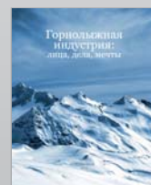
Каталог Горнолыжная индустрия