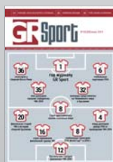
Журнал GR Sport